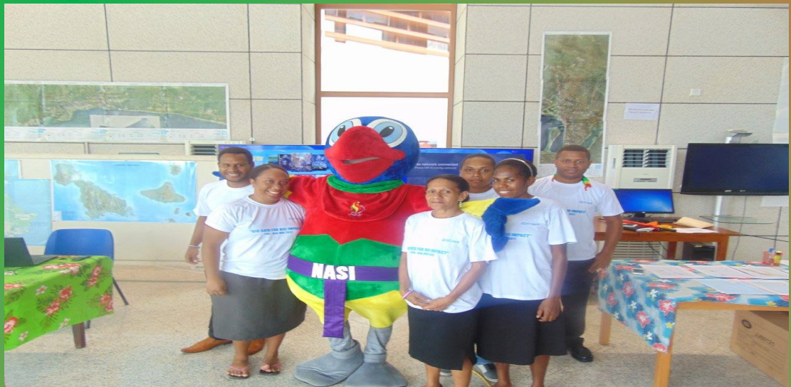
Les employés en photo avec Nasi