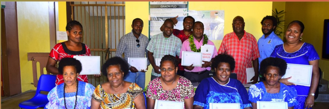
Les participants et leurs certificats