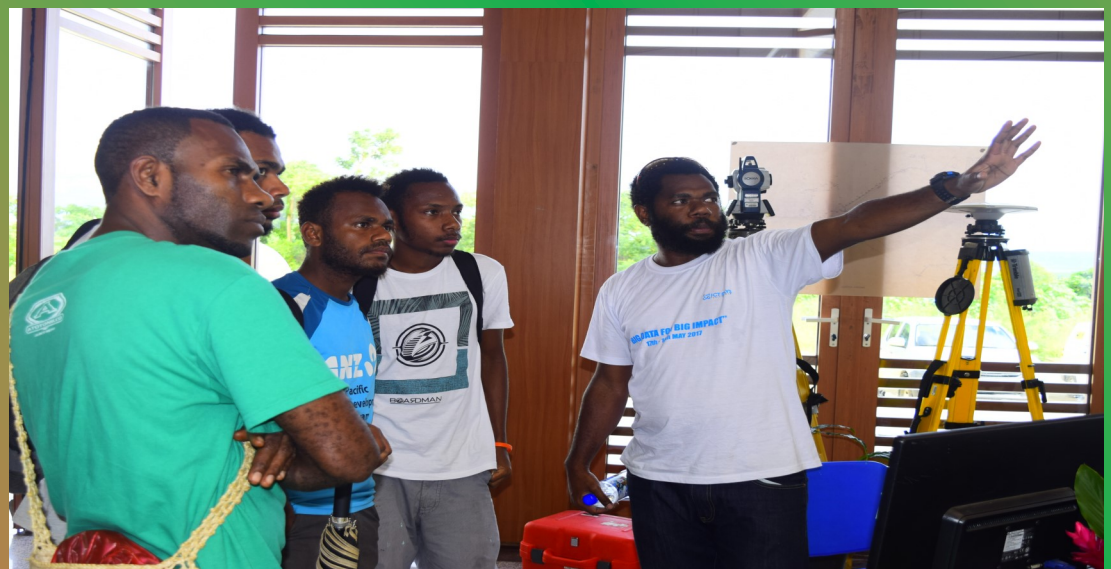
L'arpenteur-géomètre explique son travail aux étudiants qui sont venus visiter le stand de MoL & NR.