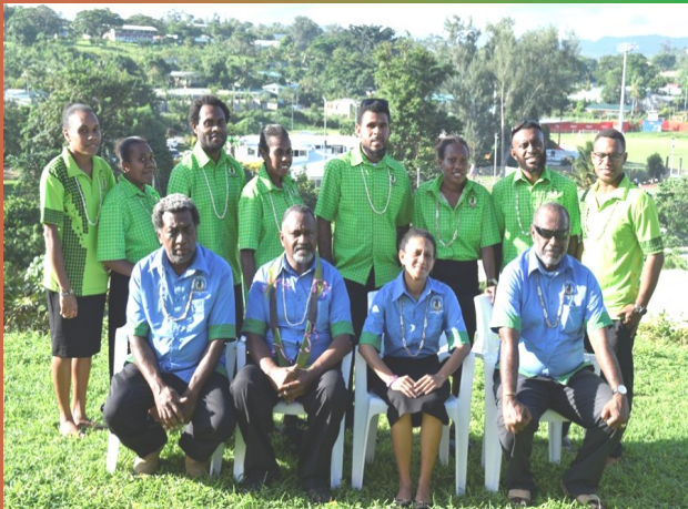
L'équipe de la section des services généraux avec leurs nouveaux uniformes

La section des services généraux lance leur nouvel uniforme (13/04/17)